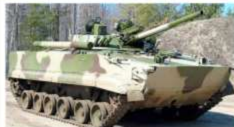
БОЕВАЯ МАШИНА ПЕХОТЫ