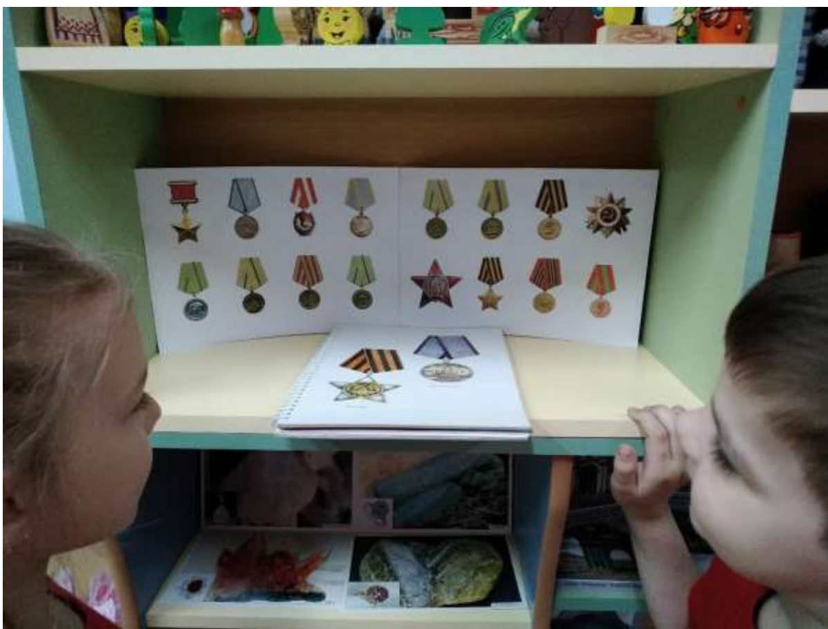
Дидактическая игра «Защитники Отечества».