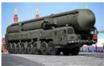
СТРАТЕГИЧЕСКАЯ РАКЕТНАЯ УСТАНОВКА