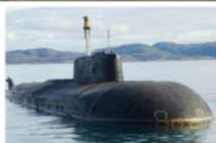
АТОМНАЯ ПОДВОДНАЯ ЛОДКА