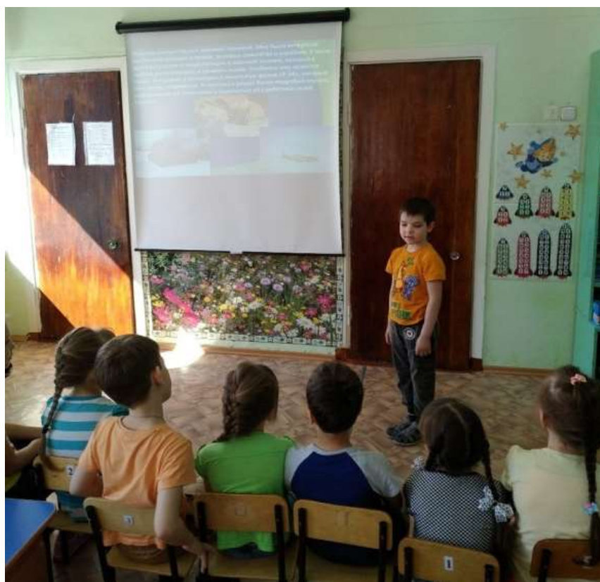
Презентация детского проекта «Танк Победы»