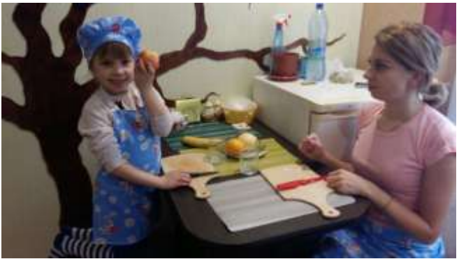
Очищаем от кожуры