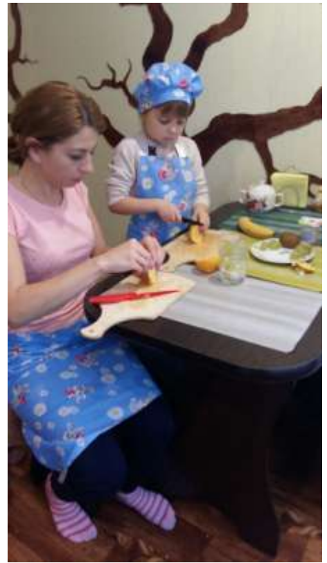
Режим фрукты для салата