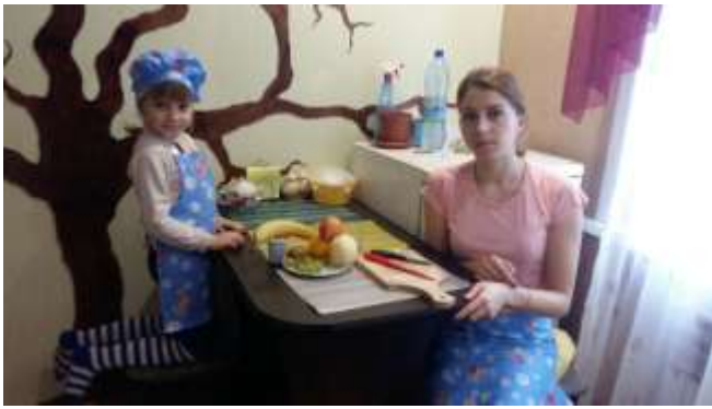
Фрукты для салата